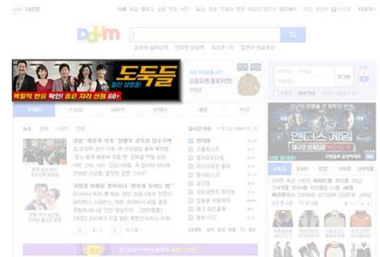
3. 브랜드 정보 추가 노출 - 일반 PC DA상품 추가제출