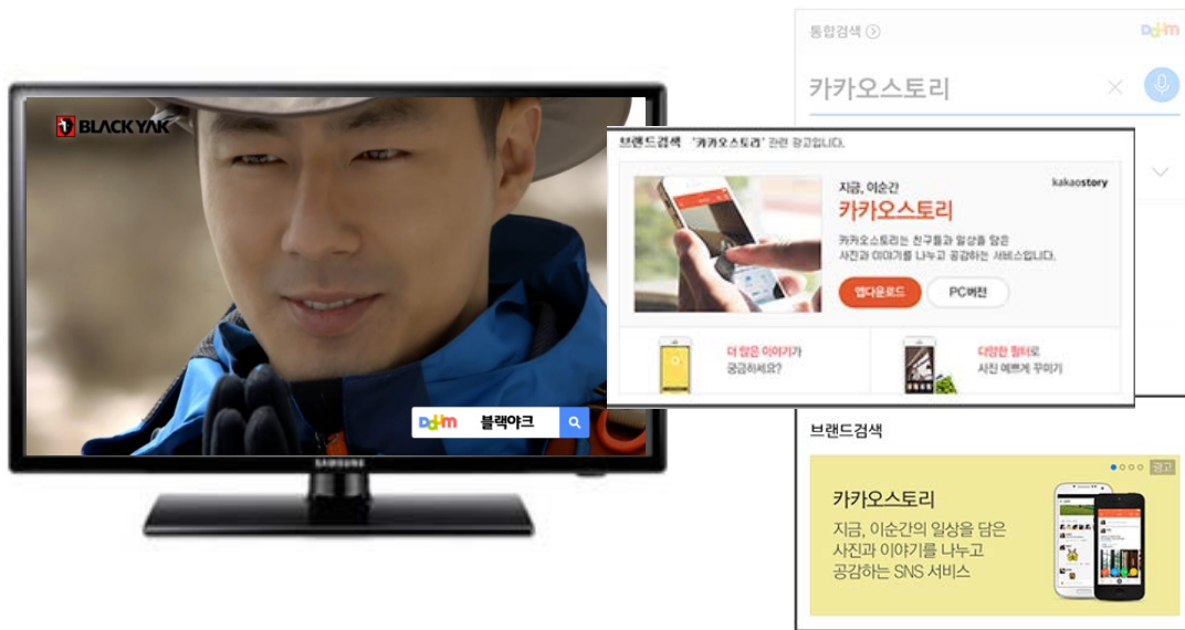
1. 오프라인 광고에 검색창 & 키워드 노출

오프라인으로 크로스미디어를 노출하여 자연스럽게 온라인으로 소비자를 유도하여 온오프가 결합된 다양한 접점으로 광고주의 브랜드정보를 보다 효과적으로 제공할 수 있습니다.